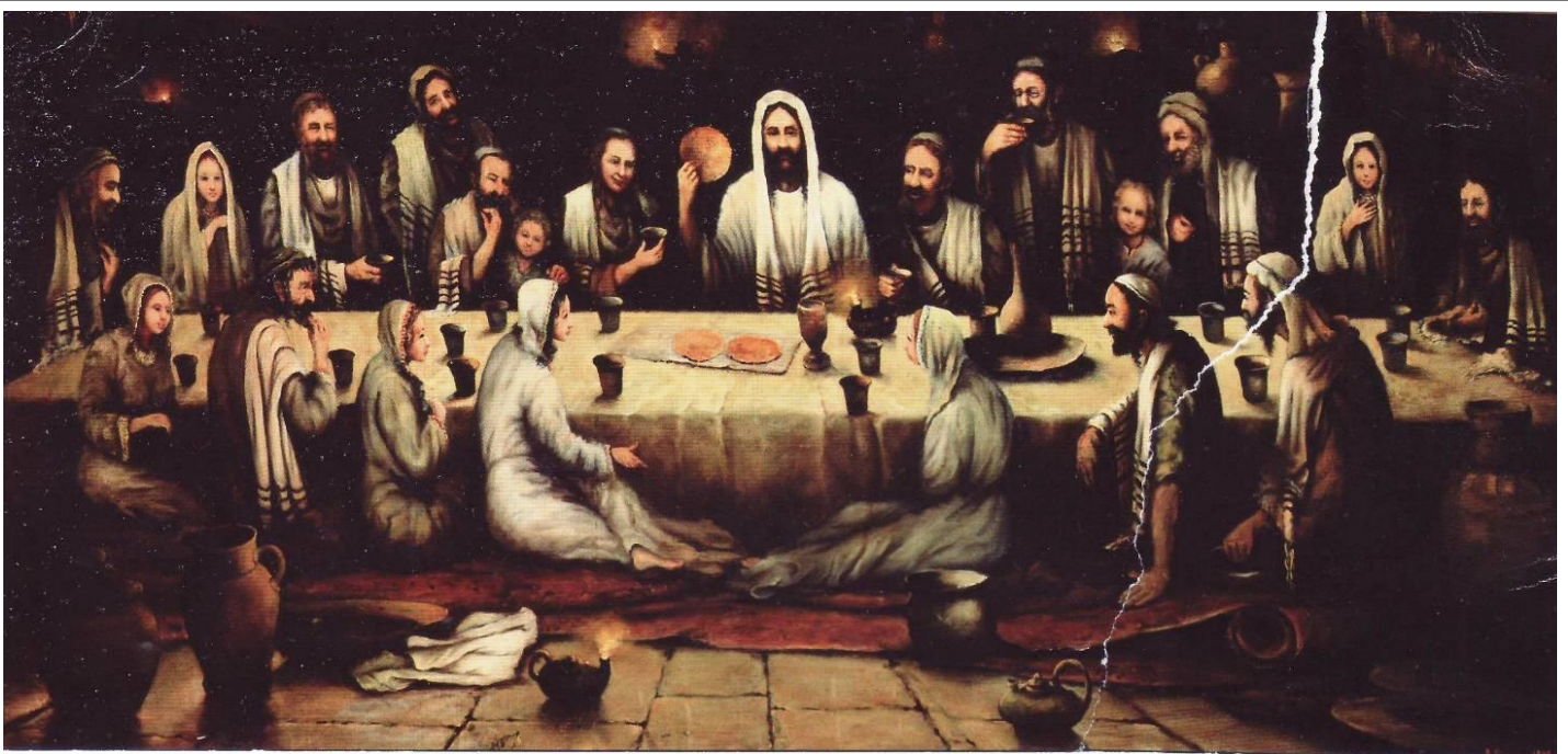
Hommes et femmes à Sa Table

Enfin, cette Parole de Jésus, à Sa Table, est pour nous « Pèlerins d'Espérance » : « Aussi, je fais pour vous comme mon Père a fait pour moi en me donnant la royauté : vous mangerez et vous boirez à MA TABLE dans mon Royaume. » (Lc 22, 29-30)