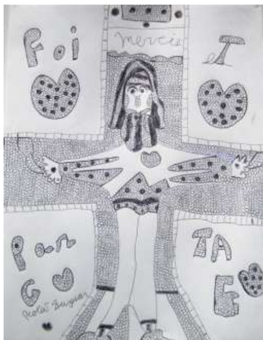
Dessin de Robert Dupuis, Valleyfield