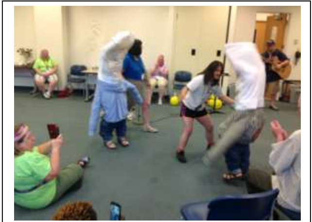
Sketch amusant à Cleveland

J'ai écouté la communauté de Nouvelle-Écosse discerner s'il y avait lieu de faire une retraite cette année. En fin de compte, ils ont ressenti le besoin de l'annuler en raison du faible nombre de participants et de quelques annulations de dernière minute. Un choix difficile. La réalité d'une communauté vieillissante et fragile.